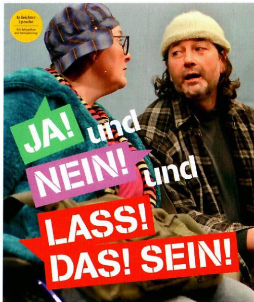
Ein theaterpädagogisches Präventionsprogramm über das Recht auf Grenzen